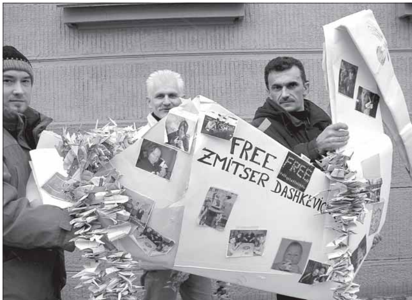
Правозащитники передают журавликов, сделанных активистами «Международной Амнистии» в знак солидарности с белорусскими политзаключенными, министру внутренних дел В. Наумову, Минск