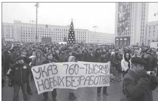
10 декабря. Минск. Предприниматели протестуют