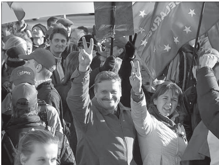
Европейский Марш, 14 октября, Минск