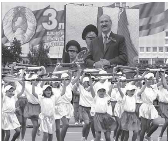
Празднование официального Дня независимости, Минск, 3 июля