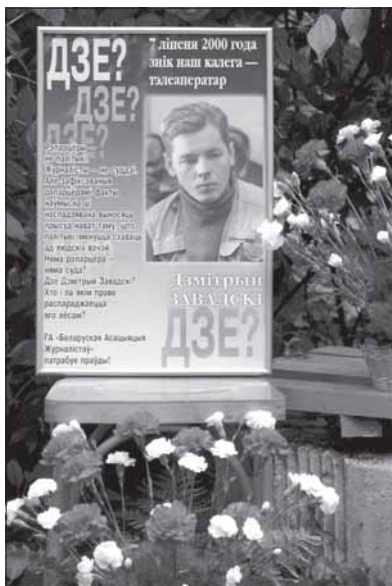
Семь лет назад исчез журналист Дмитрий Завадский. 7 июля, Минск