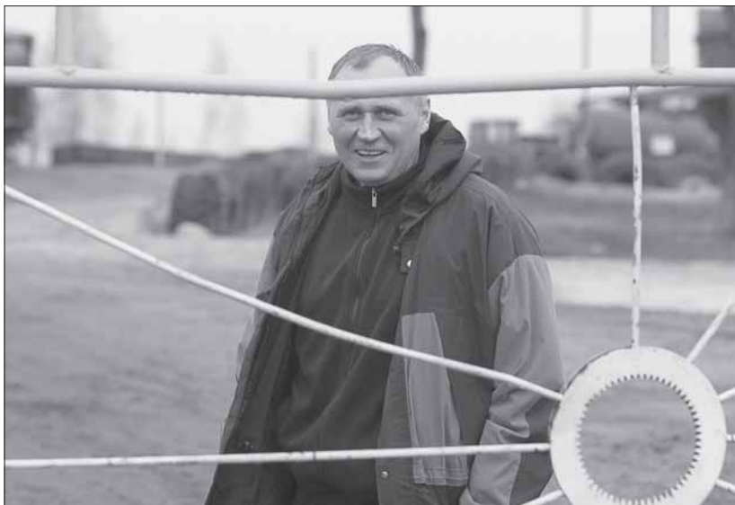
Политик Николай Статкевич во время отбытия наказания, деревня Блонь Минской области