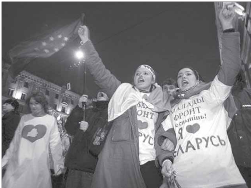
Акція «Молодого Фронта» в День святого Валентина, Мінск