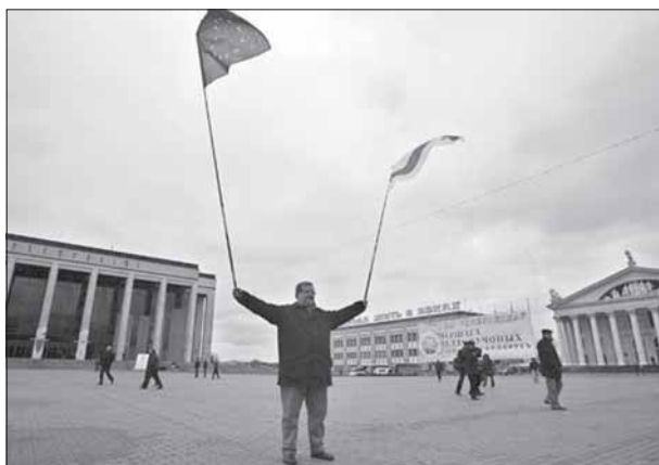
Национальный флаг и флаг Евросоюза на Октябрьской площади, 4 ноября, Минск