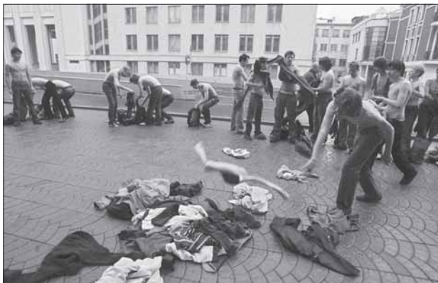
Студенческая акция против отмены льгот возле здания Министерства образования, Минск, 10 мая