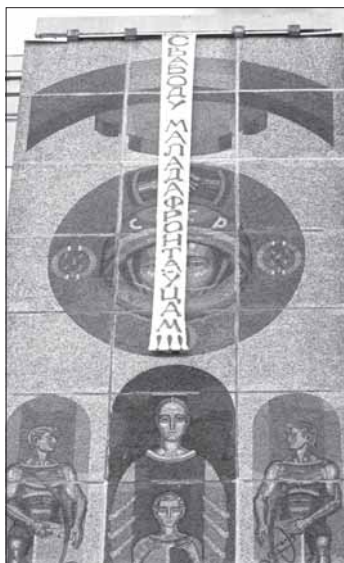
Растяжка в Минске «Свободу молодифронтовцам!!!»