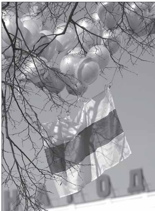
Национальный бело-красно-белый флаг над площадью Победы в Минске, 10 марта